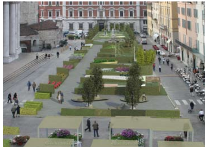
Rendering, veduta d'insieme di Fiorinisieme 2010, Arch. Nicola Faustini e studioDprogettazione

L' Associazione Florovivaisti Bresciani , con questo ambizioso progetto, si pone l'obiettivo di diffondere una corretta conoscenza e cultura dell'ambiente che troppo spesso viene a mancare, ma che oggi necessita di maggior attenzione, poichè giardini, parchi e terrazzi non debbano essere soltanto gradevoli esteticamente ma che possano anche inserirsi armoniosamente nel proprio contesto ambientale , senza alterare le dinamiche e i processi naturali , scegliendo quindi essenze adatte al nostro clima, evitando trattamenti chimici e favorendo la presenza di insetti predatori e uccelli insettivori.